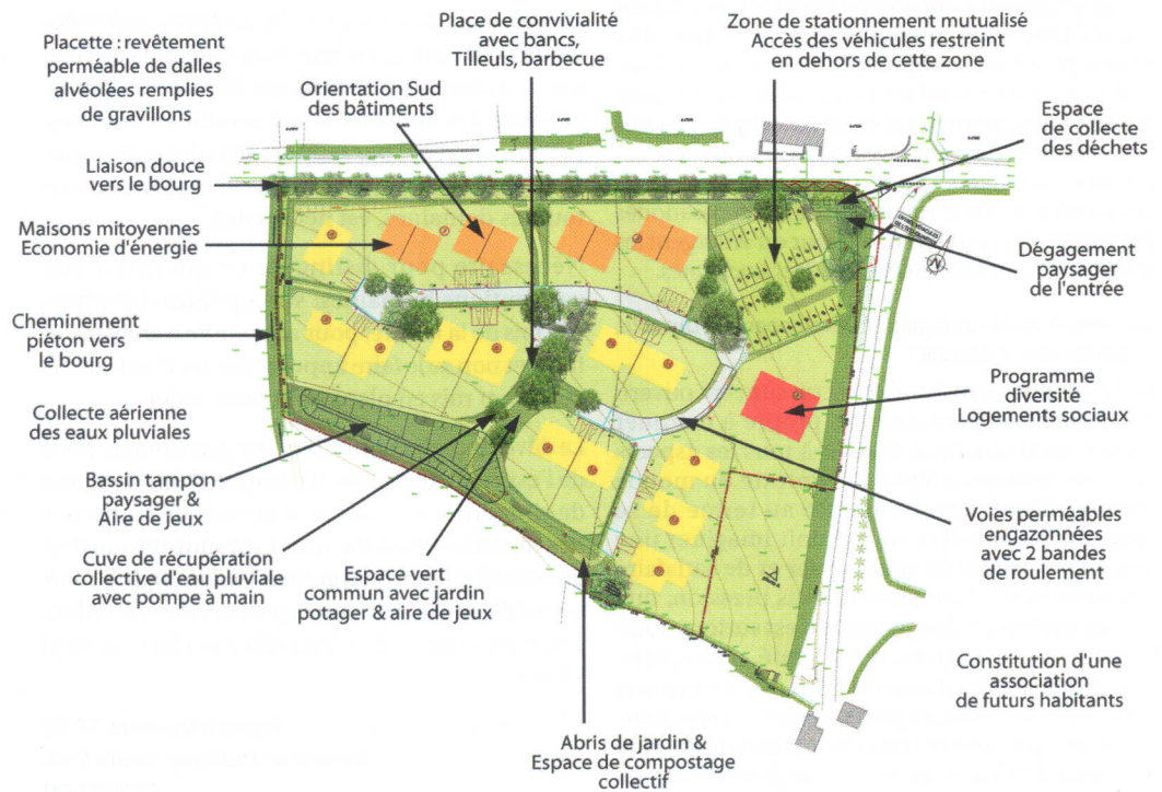
Plan masse de l'éco quartier de Plogastel St-Germain (Finistère) : un aménagement et des techniques au service d'un projet de ville.

Au-delà de l'ouvrage, c'est le service rendu qui compte, et cela dans la durée. L'ouvrage, maison, route, pull-over ou manteau n'a pas de sens en soi, si ce n'est de rendre un service d'accueil, de mobilité, de confort ou même de coquetterie. Il peut y avoir de nombreux moyens de rendre le service, et ces moyens évoluent dans le temps : telle réponse innovante hier apparaît comme inadaptée aujourd'hui. Le développement durable nous conduit donc à privilégier la fonction sur l'ouvrage, le service sur l'équipement, qui est déjà un choix et qui restreint le champ du faisable, au lieu de l'ouvrir le plus large possible.